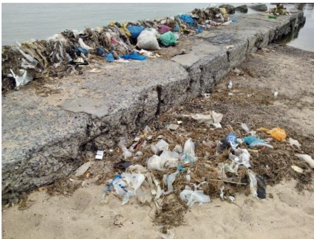
Рис. 1.1. Пластиковый и полиэтиленовый мусор побережье район Приморского парка

Ежедневно силами работников городских пляжей вывозятся мешки пластикового мусора, а что происходит на территории остального побережья, которой не оказывается такого внимания?