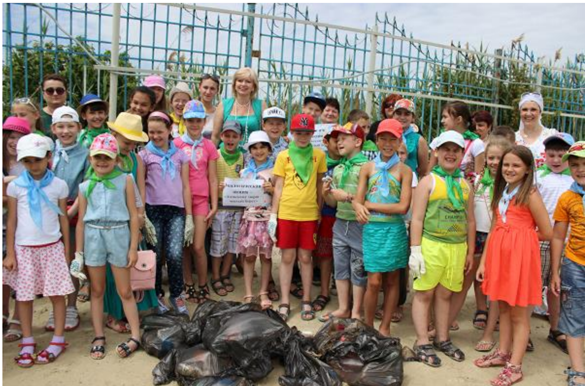
Рис. 2.4. Участники акции «Азовскому морю – чистый берег»

Экологическая акция пройдет по следующему маршруту: пер. Большой Садовый – ул. Лесная Биржа – 2-ой Лодочный пер. – побережье г. Таганрога. (Приложение 3)