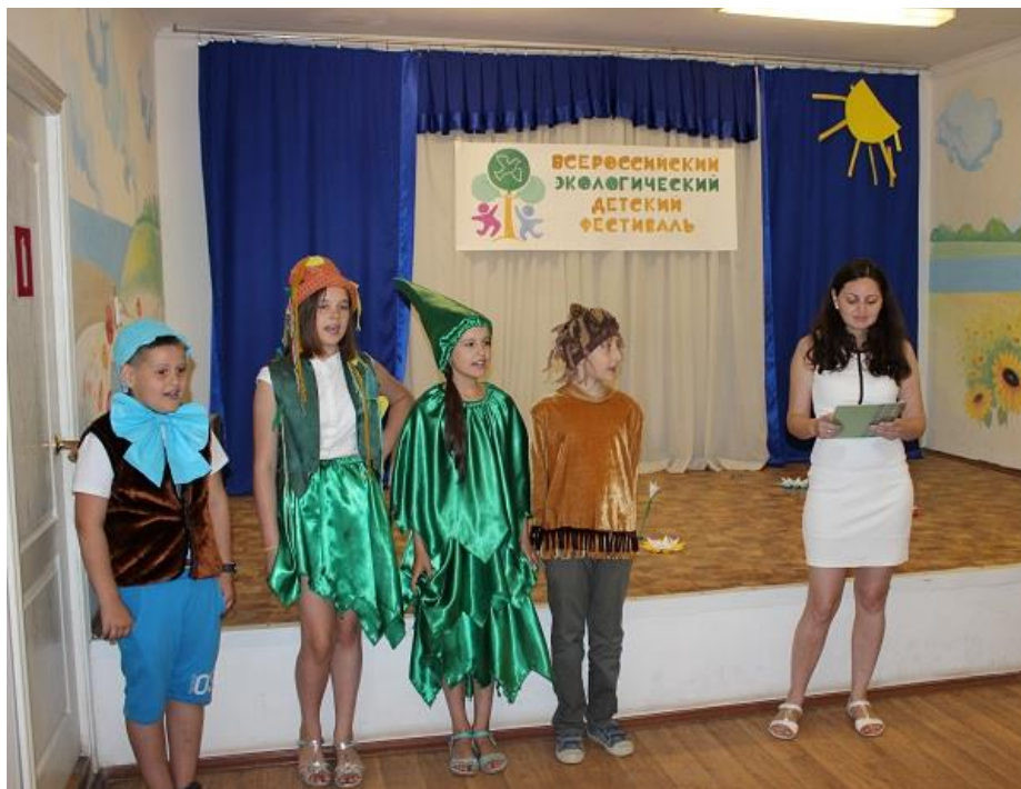
Рис. 2.1. Эколята