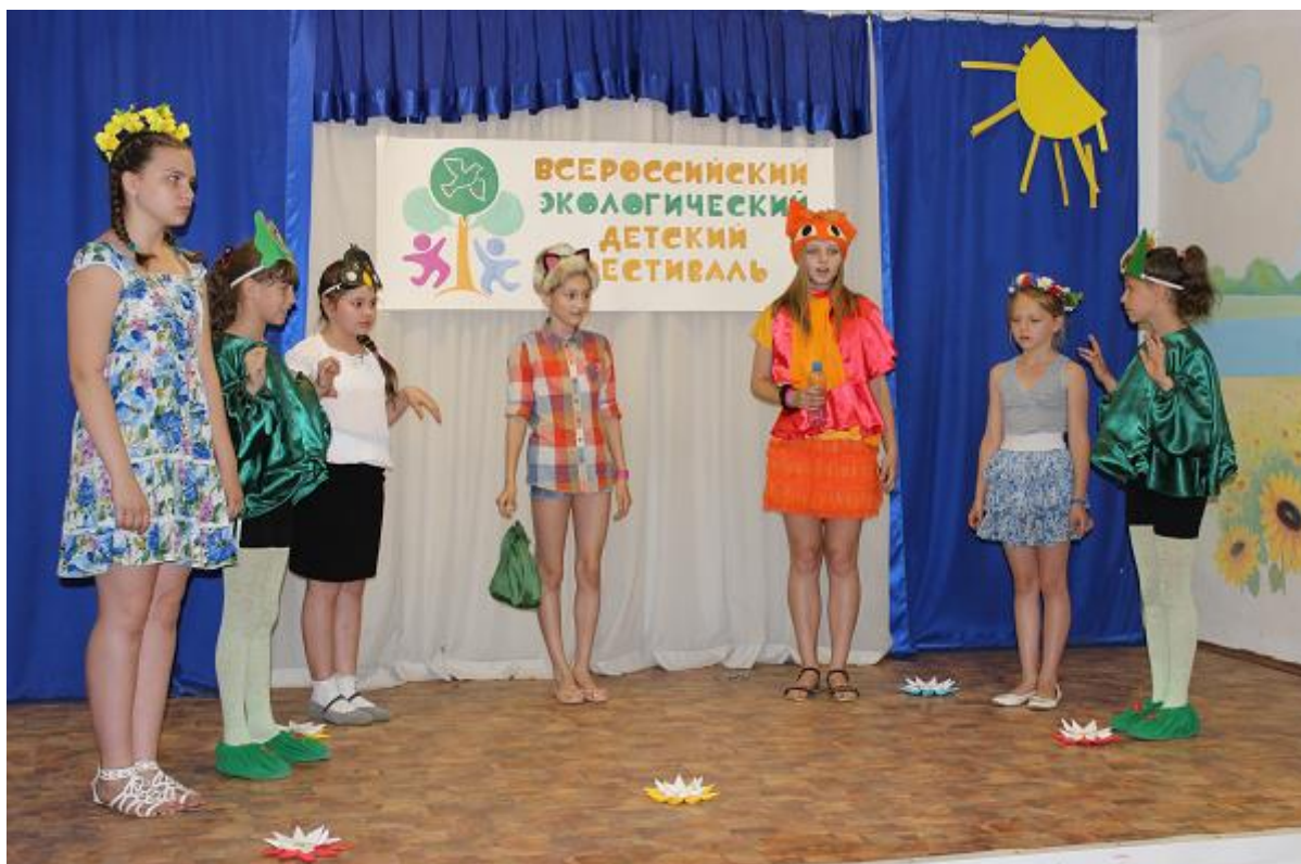
Рис. 2.2. Экотеатр

Лиса. – Приносите все пластиковый мусор в нашу организацию «ЭкоБудущее», не выбрасывайте его на свалку. И тогда моря и озера, и леса, воздух и почва, будут чистыми, а наша планета Земля будет вам благодарна.