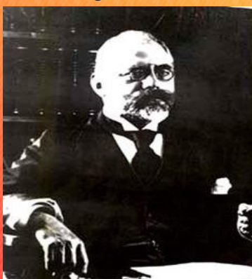
Ганс фон Пехманн

6. Истории полиэтилена более века. Мнения по поводу его получения расходятся. Одни говорят, что его случайно, в 1899 году получил немецкий ученый Ганс фон Пехманн. По другой версии впервые попытки получения полиэтилена были известны в 1884 году, русским ученым Гавриилом Густавсоном. Есть так же версия, что его сделали в 1933 году инженеры Эрик Фосет и Реджтнальд Гибсон. Спустя два